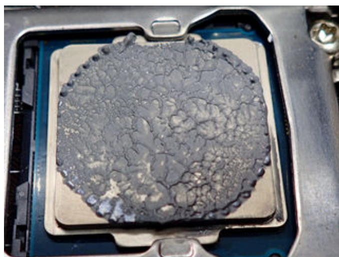
写真2. 適量塗布してクーラーを外した結果(参考)