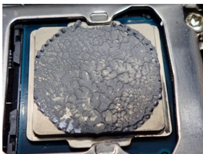
写真2. 適量塗布してクーラーを外した結果(参考)